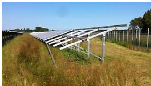
Ohne großen Aufwand überwandern die Diebe den Zaun dieses Solarkraftwerks und montieren Module für mehrere zehntausend Euro ab.